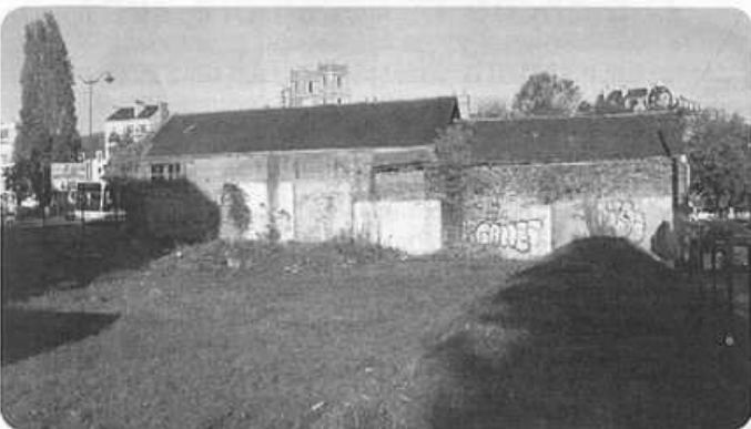
Les verrues sont parfois tenaces... Souvent aussi leur disparition est soudaine

Dans 2 à 3 ans, nous aurons donc un magnifique entonnoir de verdure qui constituera un point fort dans l'aménagement du