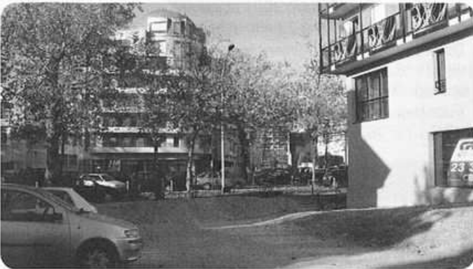
Future placette, face à la rue Coulabin

Les constructions avancent. On commence à voir se dessiner l'emplacement de la future coulée verte entre la rue Liothaud et la Vilaine ainsi que celui de la placette qui la prolongera en direction du Mail.