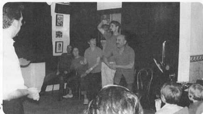
Match d'improvisation par l'atelier théâtral de Bourg l'Évêque (22 juin 2007)