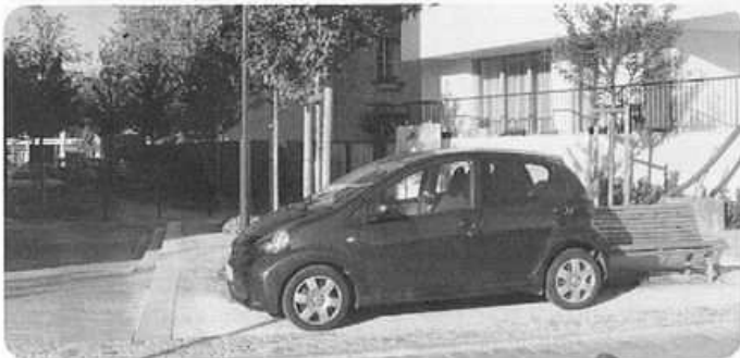
La placette défigurée

La petite placette joliment aménagée qui fait pendant à l'allée piétonne (toujours sans nom) de l'autre côté du Mail connaît aussi des stationnements inacceptables de voitures. Il conviendra de les rendre impossibles par la mise en place de légers dispositifs appropriés.