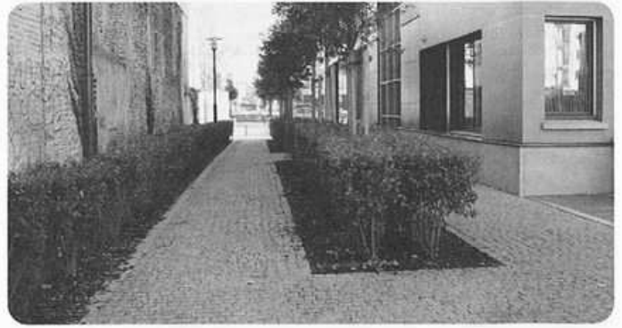
L'allée, bientôt baptisée ?

En perspective de la Vilaine à travers une esplanade bientôt libérée