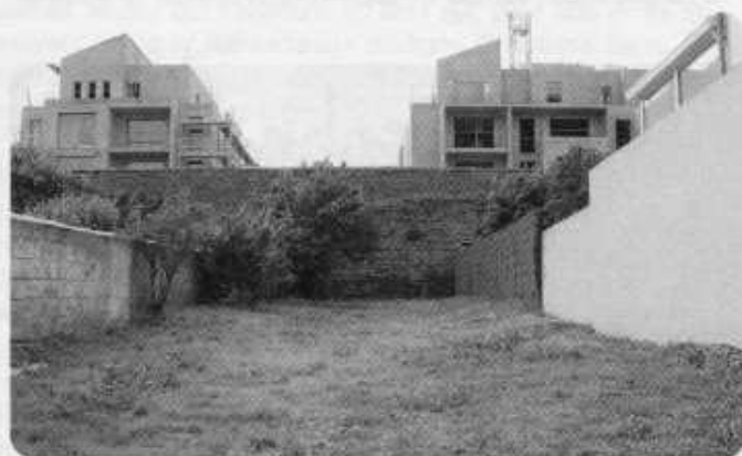
Mur de l'ex-caserne et futur cheminement piéton ?

Pour en profiter, la Ville de Rennes a prévu un cheminement piétons-vélos à partir du percement du mur d'enceinte. Pour que cette opération du plus grand intérêt ne soit pas vaine, il est désormais urgent que le projet de passerelle sur le canal entre dans sa phase décisionnelle.