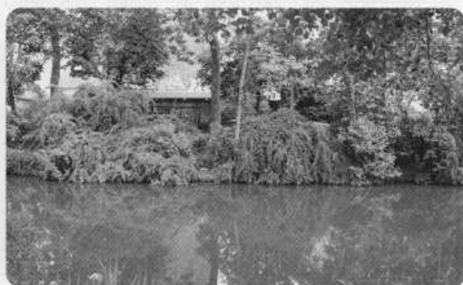
Le canal où se situera la future passerelle ?