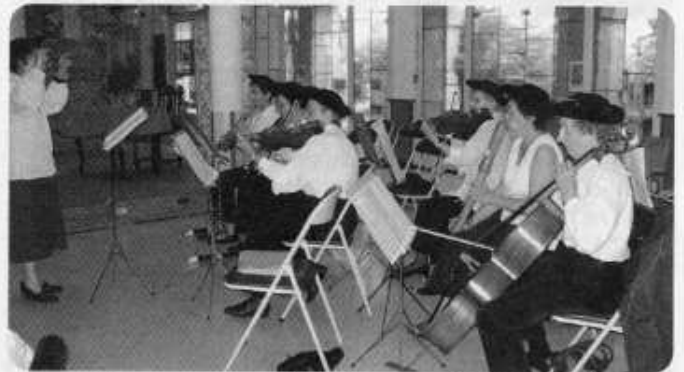
L'accompagnement de la pièce par le Cercle Musical

Contact : Christophe Loviny 02.99.33.09.98 ou 06.88.44.33.24