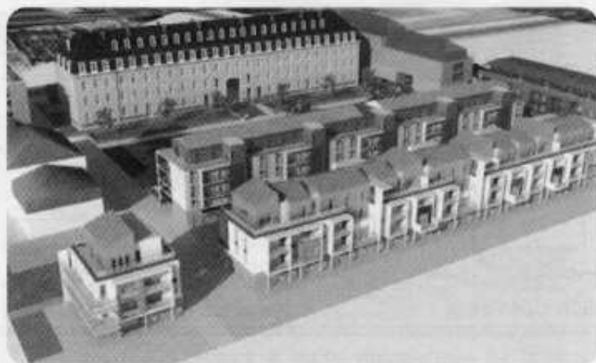
Photo-montage de la ZAC Mac Mahon