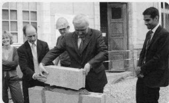
Pose de la 1 re pierre le 22 mai par le maire de Rennes