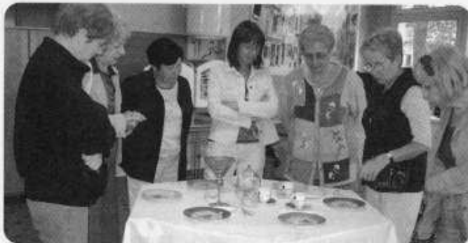
L'exposition de porcelaines peintes le 7 juin

Contact : Catherine Degouey 02.99.05.09.65 ou 06.83.68.46.15