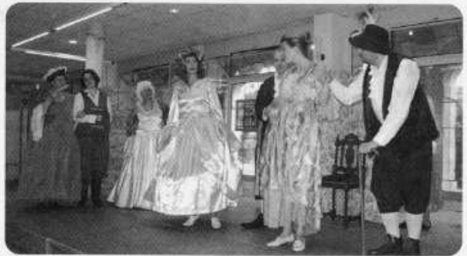
Représentation théâtrale le 8 juin à St-Cyr