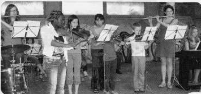
Le Cercle Musical fête la musique

Rendez-vous donc jeudi 25 septembre à 20h30, salle polyvalente 16, rue Papu.